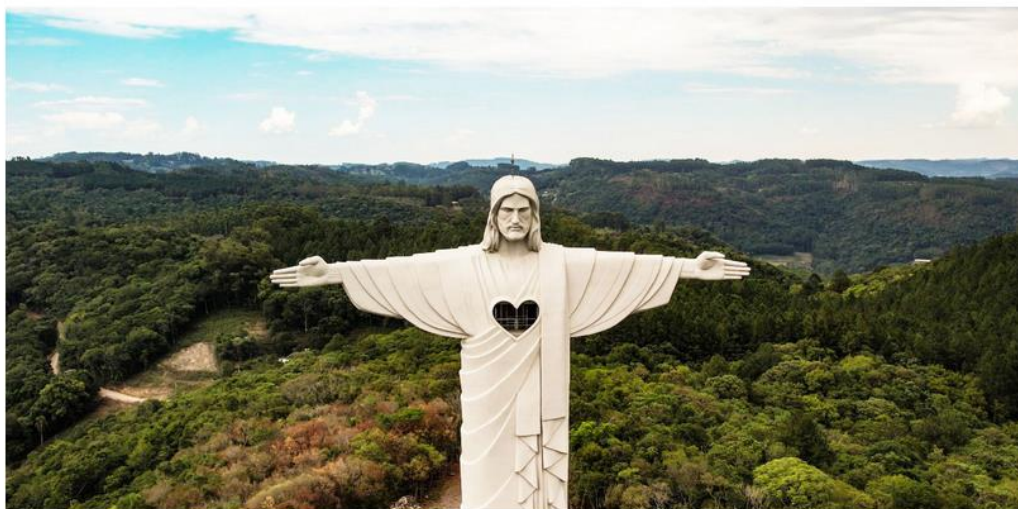
Cristo Protetor é um dos destaques do estande do governo gaúcho na feira em Brasília

Representantes do Vale participam de evento que ocorre em Brasília. No estande da secretaria estadual de Turismo, o Cristo Protetor está em evidência